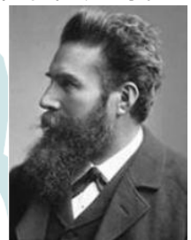
W. C. レントゲン博士

南ドイツのロマンチック街道の北端に位置する学園都市ヴュルツブルクで1895年暮れ、ヴュルツブルク大学の物理学教授レントゲン博士は新種の光線を発見しました。真空放電の実験中に偶然発見されたこの光線は、「未知のもの」と言う意味を込めて「エックス線」と名づけられました。