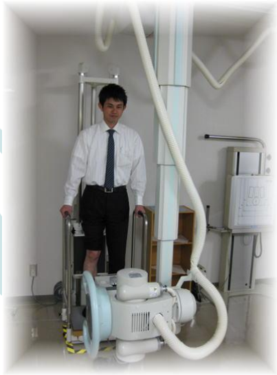
昇降式立位撮影台

大病院のような最新鋭の機器はありませんが、患者さまに、安全に安心して検査を受けていただくことを目標として、技術や知識の研鑽に励んでおります。